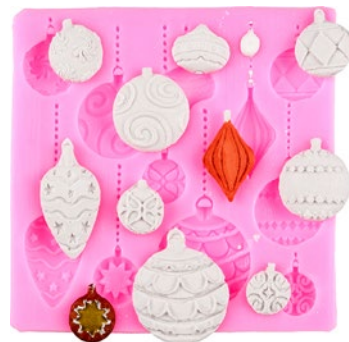
Boules de Noël